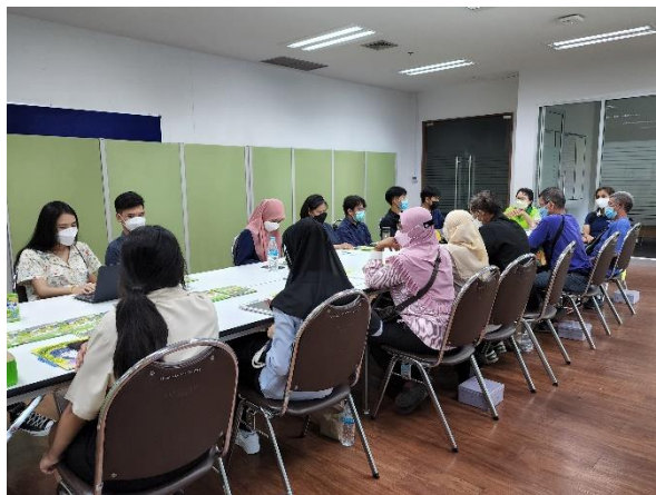
13) ประชุมแก้ไขปัญหาคลองยายจิ้น ที่โรงเรียนบดินทรเดชา(สิงห์ สิงหเสนีย์) 2 วันที่ 26 กันยายน 2565