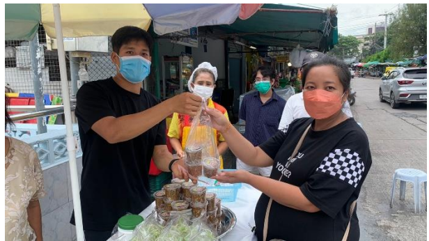
4) แขวงประเวศ เขตประเวศ กรุงเทพมหานคร (ตำบลใหม่)