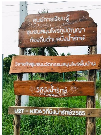
(1) พัฒนาเส้นทางท่องเที่ยว