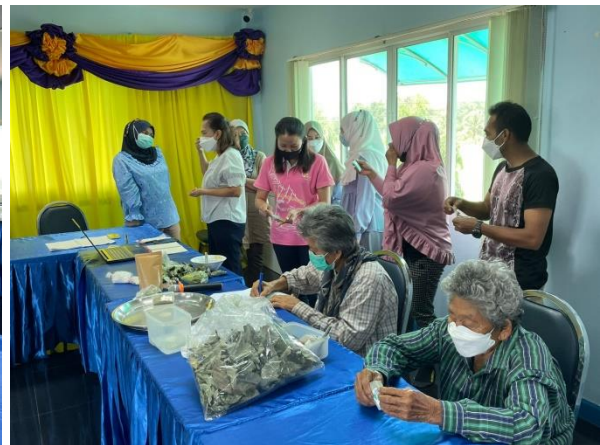
12) ประชุมสรุปกิจกรรมเขตบางกะปิและเขตประเวศ วันที่ 25 กรกฎาคม 2565 ที่ห้องประชุมโครงการชั้น 18 อาคารนวมินทราธิราช นิด้า