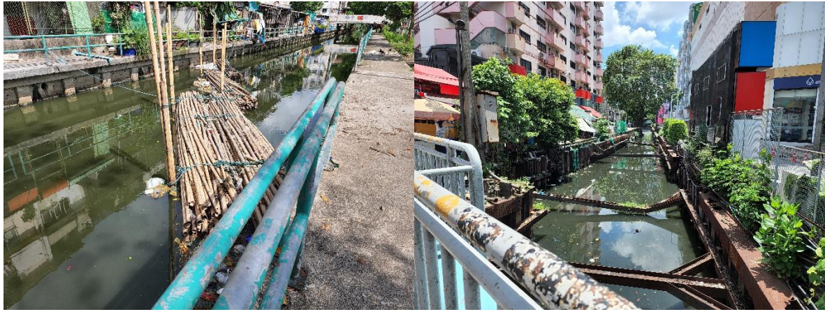
3) ตรวจสอบและปรับปรุงการทำน้ำหมักชีวภาพศูนย์การค้าแฮปปี้แลนด์ วันที่ 24 มีนาคม 2565