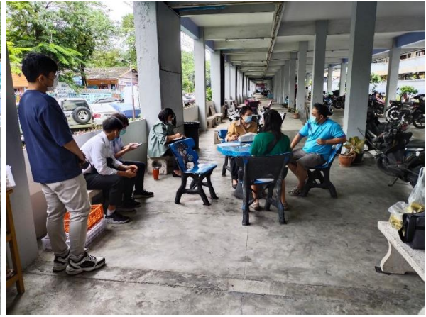
10) ประชุมการจัดการสิ่งแวดล้อม การจัดการขยะที่แพลตฟอร์มจัน 1-15 วันที่ 15 กรกฎาคม 2565 แพลตฟอร์มจัน 11 เขตบางกะปิ